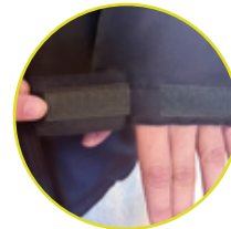
AJUSTE DE MANGA CON VELCRO